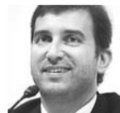
FERRAN SORIANO PRESIDENT DE SPANAIR

«En el futur, Spanair podria sortir a borsa o entrar en un grup, però el hub de Barcelona sempre tindrà sentit»